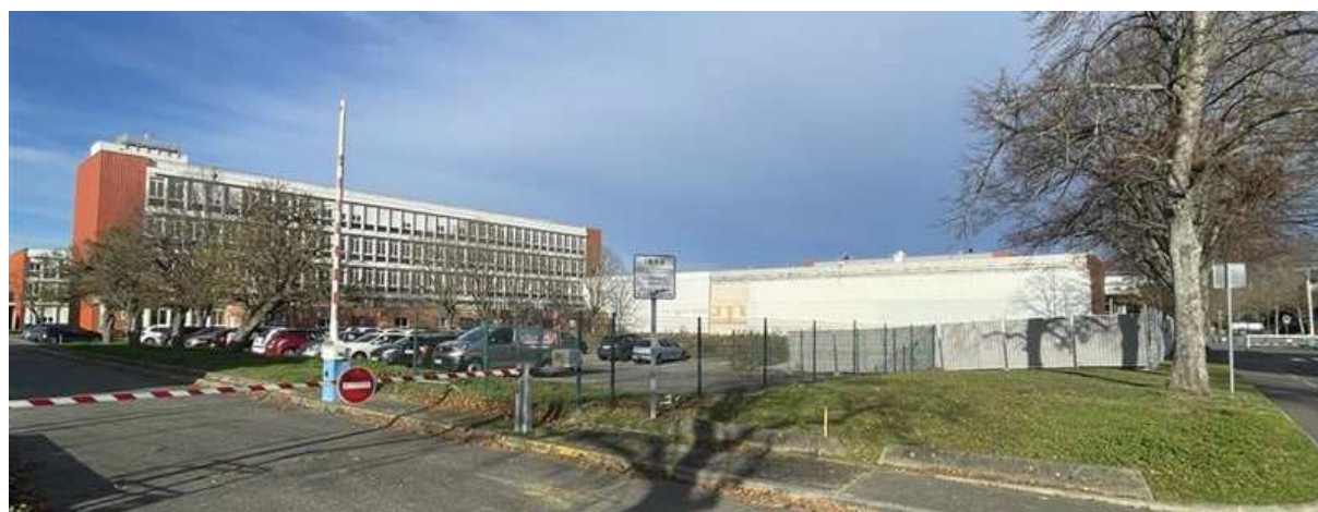
Zone extérieure impactée par le projet de construction du B11 et de réaménagement des extérieurs + B17 en fond